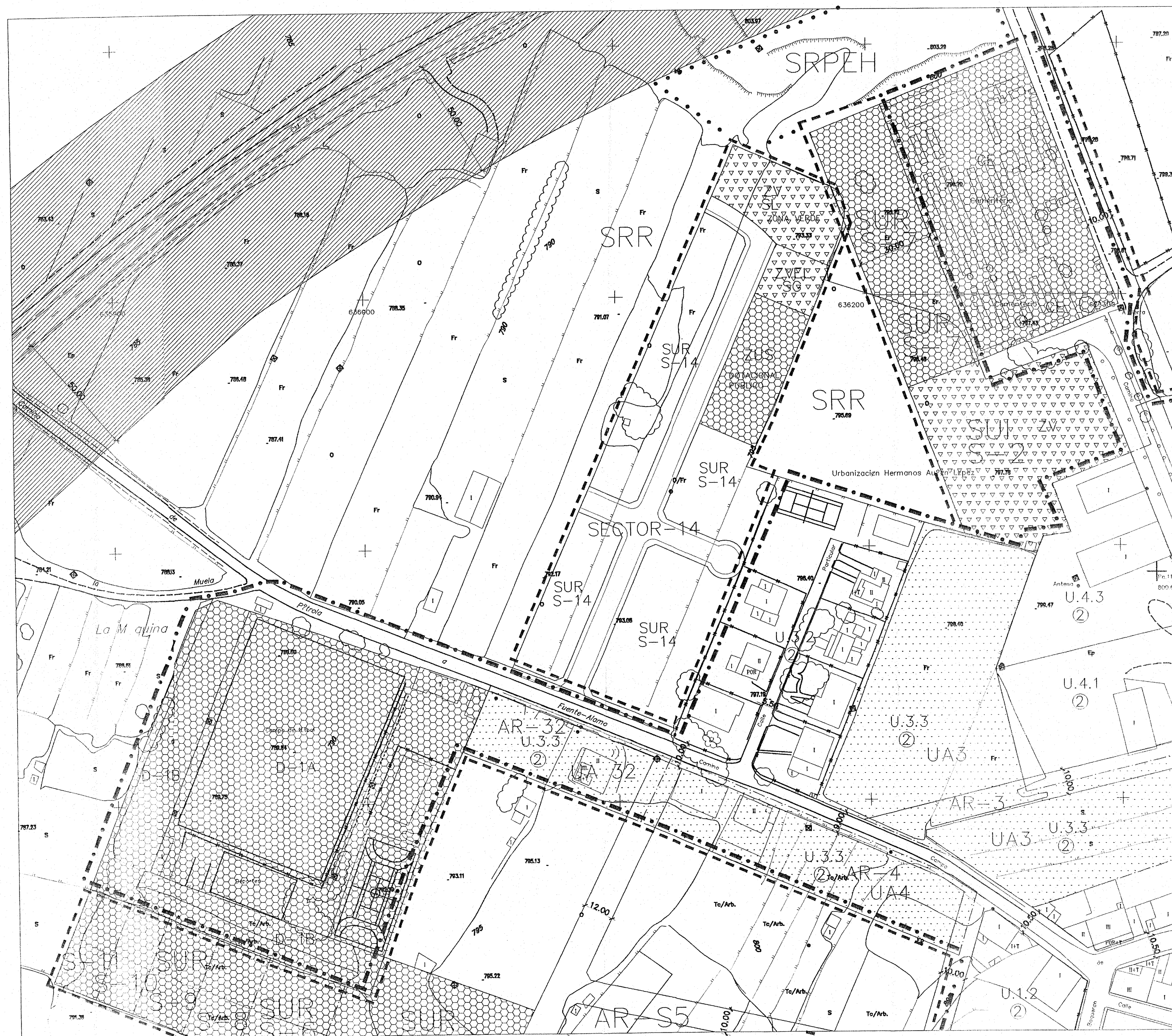
HOJAS PARCIALES NUMEROS 2 Y 5 DEL PLANO DE CLASIFICACION Y CALIFICACION DE SUELO URBANO DEL P.O.M. DE FUENTEALAMO